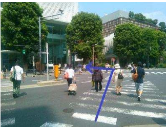
スクランブル交差点を渡って左へ

②スクランブル交差点を渡ります。 高島屋の横を左に曲がって入っていきます。 人通りの多い少し狭い歩道を歩いていきます。