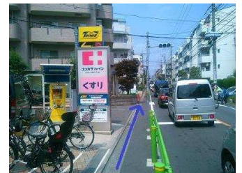
ココカラファインを通り過ぎます。