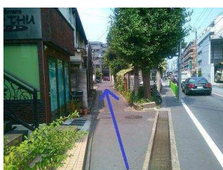
斜め左の細い道へ入ります。