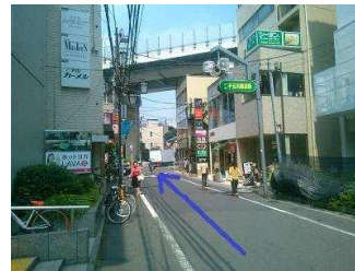
上に高架道路が見えてきます。

③高架となっている国道246号線(厚木街道)の下をくぐります。 自転車屋の正面の道へ、左に曲がって進みます。