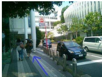
少し狭い歩道を歩いていきます。

③高架となっている国道246号線(厚木街道)の下をくぐります。 自転車屋の正面の道へ、左に曲がって進みます。