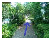
しばらく緑を楽しんでください。