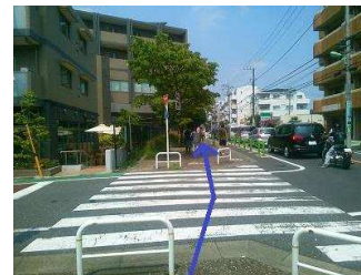
左にスタバ、右にファミマがあります。