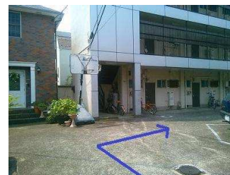
まっすぐ進み、突き当たり正面にあるバスケットゴールの前を右へ。

⑦正面にバスケットゴールが見えてきますので、そこを右へ曲がります。 1F中央の部屋が二子玉オフィスです。