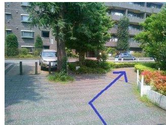
右にある緑道へ進みます。