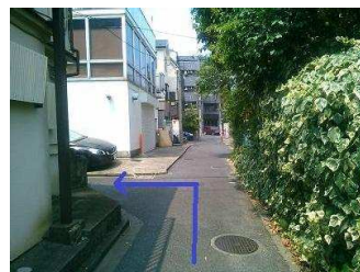
すぐ左へ曲がります。

⑦正面にバスケットゴールが見えてきますので、そこを右へ曲がります。 1F中央の部屋が二子玉オフィスです。