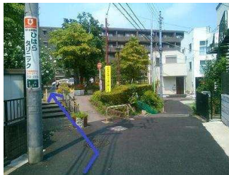
しばらく進み、左にある階段を登ります。