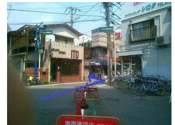
高架をくぐったら、自転車屋の前を左へ